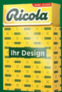
Box mit Sleeve