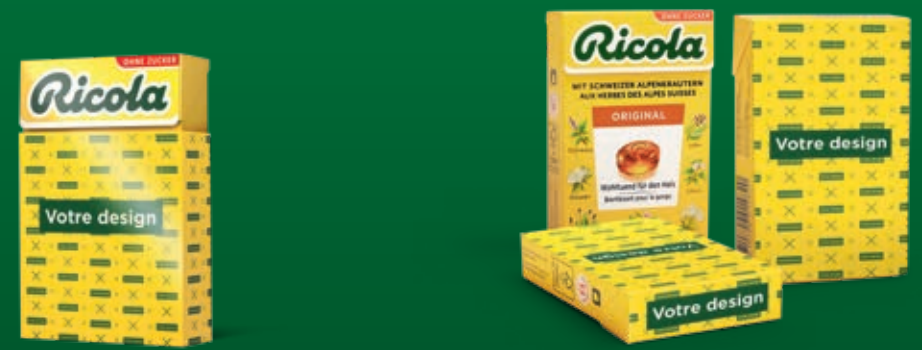
Boîte avec ruban personnalisé